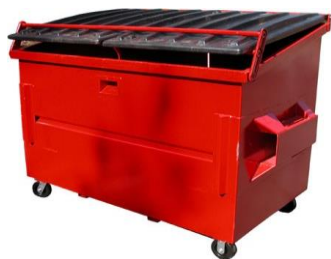
Κάδος πρόσθιας φόρτωσης

Για την προσωρινή αποθήκευση στα ΠΣ των επιτρεπόμενων κατηγοριών αποβλήτων, χρησιμοποιημένων αντικειμένων και εξοπλισμού, πρέπει να χρησιμοποιούνται κατάλληλοι περιέκτες, όπως κάδοι, σκάφες (skips) ή εμπορευματοκιβώτια (containers), διαφόρων μεγεθών, αναλόγως της έκτασης του ΠΣ και των αναμενόμενων παραλαμβανόμενων ποσοτήτων ανά υλικό. Στη συνέχεια παρουσιάζονται (ενδεικτικά) εικόνες από διαφορετικούς τύπους περιεκτών.