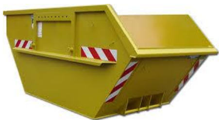
Κοντέινερ τύπου σκάφης