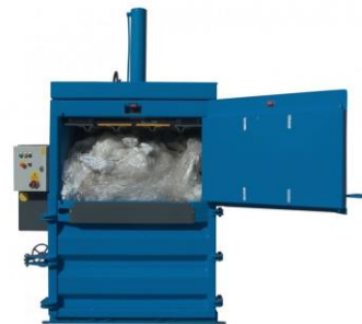
Δεματοποιητές για χαρτί / χαρτόνι και πλαστικό