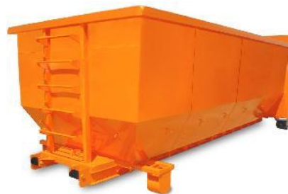
Κοντέινερ ανοικτού τύπου