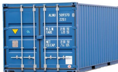
Κοντέινερ κλειστού τύπου